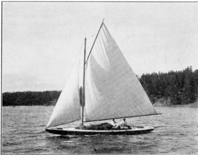
G. S. S. UTLOTTNINGSBÅT 1910.

780st sålda lotter 1560:- kostnad 1.442:43.