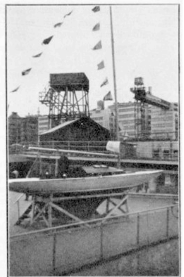
Här en bild från Slussplan, år 1943, med bevakningstorn för övervakning av Stockholms hamn, samt Katarinahissen.

1944 års lottbåt är beställd och nästan färdig. Det är en likadan M-22:a och bygges den på samma varv. Styrelsen har lagt in ansökan om att få utställa båten å samma plats som i år.