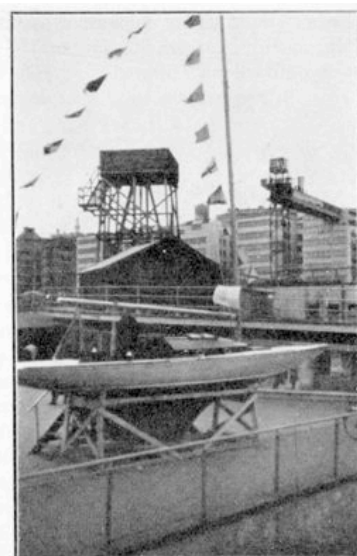
Här en bild från Slussplan, år 1943, med bevakningstorn för övervakning av Stockholms hamn, samt Katarinahissen.

1944 års lottbåt är beställd och nästan färdig. Det är en likadan M-22:a och bygges den på samma varv. Styrelsen har lagt in ansökan om att få utställa båten å samma plats som i år.