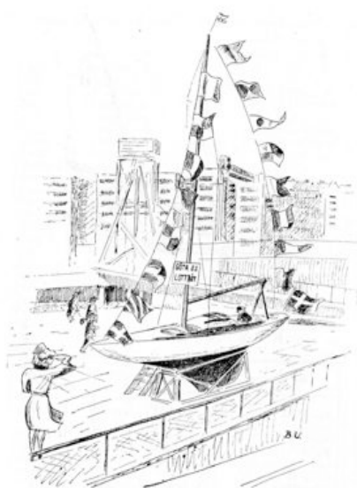
"G. S. S. utlottningsbåt 1943" uppställd på planen framför Blå Bodarne där det visade sig att lotterna hade en strykande åtgång.

Sammanställt av Dieter Bergau under hösten 2012.