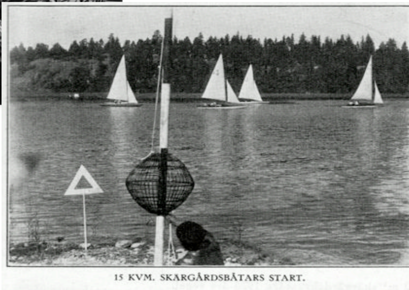
Blom med en startballong.

Bild på halad ballong vid startplatsen på Jungfruholmarna som hittades i G.S.S. årsbok1929, Högtidsseglingen, den 5 aug. 1928, är beviset.