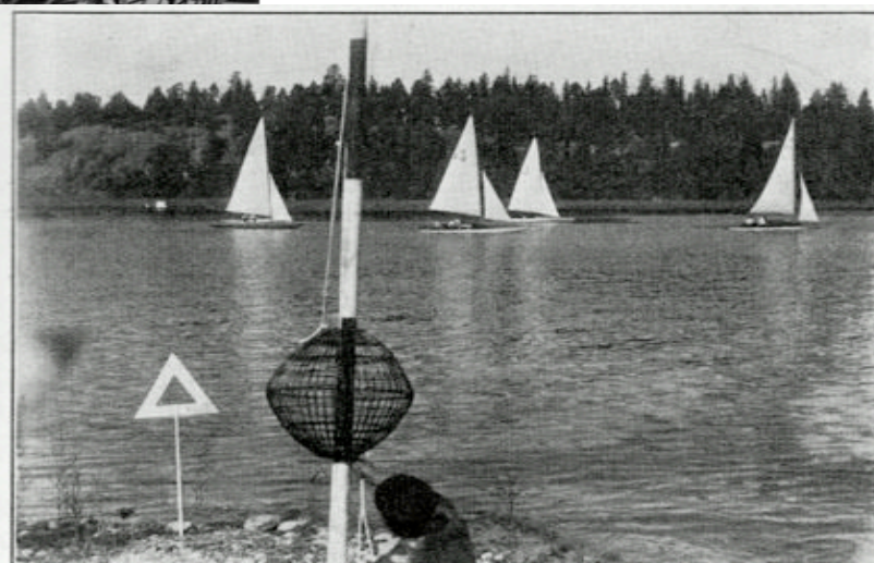
Blom med en startballong.

Bild på halad ballong vid startplatsen på Jungfruholmarna som hittades i G.S.S. årsbok1929, Högtidsseglingen, den 5 aug. 1928, är beviset.