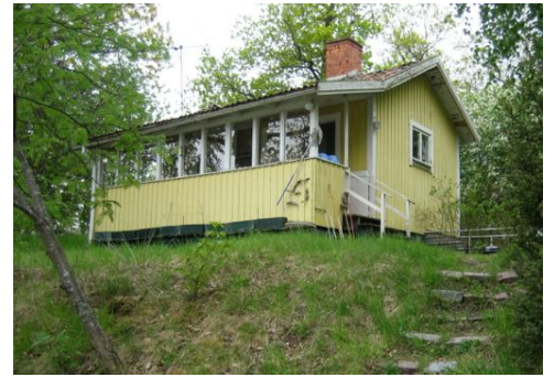
Sportstugan från 1941

Sportstugan som uppfördes på Jungfruholmarna 1941, som under lång tid hette Hildings kåk och senare kallades för Gula stugan, skulle 2007 ge plats för G.S.S. nya allaktivitetshus, Glashuset.