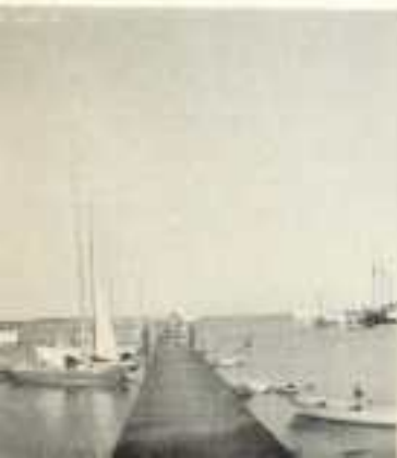
Simrishamns SS:s Brygga.

I Trelleborg låg vi kvar till tisdagen den 19 juli då vi i behagligt sommarväder med lagom sydvästlig bris avseglade med Simrishamn som närmaste hamn. Det är ungefär 50 distansminuter dit men tack vare gynnsam vind tog vi oss dit till kl. 21.00. Vi hade tänkt fortsätta tidigt på morgonen nästa dag, men Simrishamn, och framför allt dess segelsällskap, är en angenäm bekantskap, som gjorde att vi inte kom iväg förrän kl. 15.00.