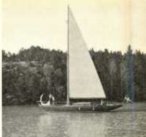
S/Y »Bellus». Agure B. Rydholm.

Clipper blev överlägsnet bästa M 25:a med två segrar. På andra plats kom ÅSS-sekretären Evert Merins välskötta Margott IV. Sjöväxet laded en ny seger till raden av föregående bland B 22:orna. Likaledes segervana Hëxan triumferade i M 22-klassen (inte mindre än 15 båtar) med Colibro som två och Mambo som trea.