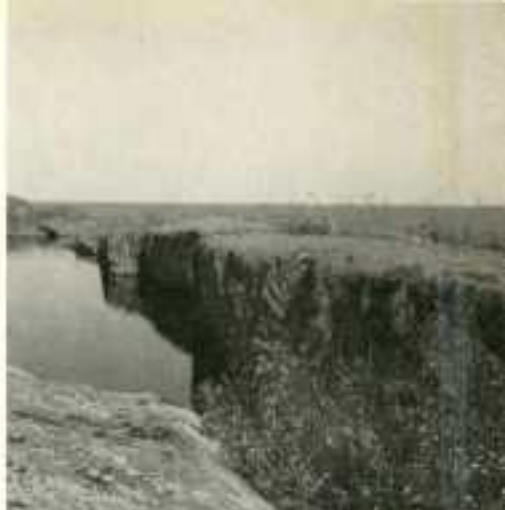
Från Östgötskärgården.

in till Bergkvara på kvällen. Liksom vid tidigare besök här, gick vi in i den lilla hamnen vid silo-byggnaden, men nu har Bergkvara även fått en ny fin fiskehamn en bit längre norrut i samhället.