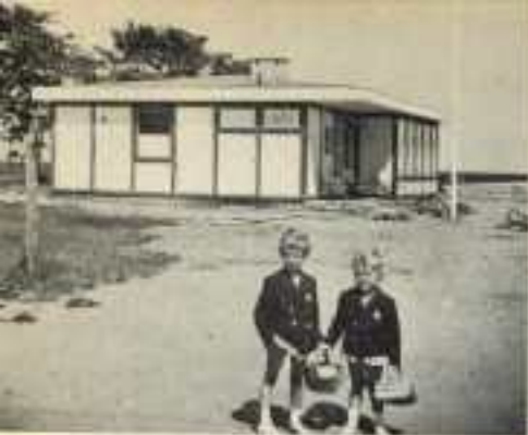
Simrishamns SS:s Klubbhus.