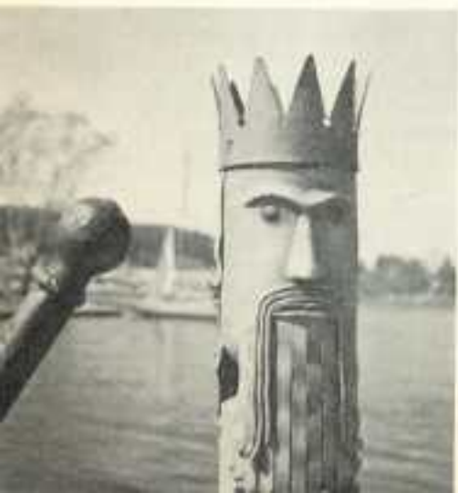
»En skärv åt Neptun ger lycka på färdens.»