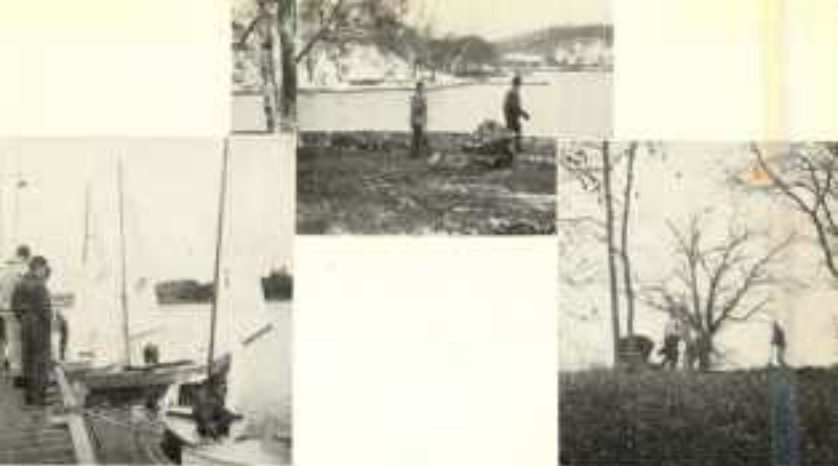
Bigge och Bella m. fl.