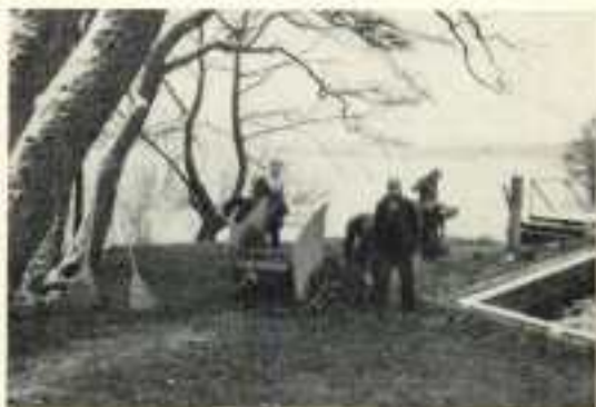
Höstaövning på Jungfruholmarna.