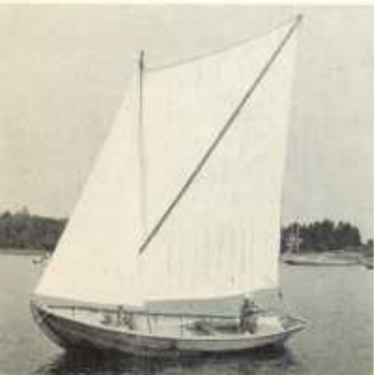
Segelbåt, Gryts skärgård.

Efter en kort visit i Borgholm på tisdagsförmiddagen fort- satte vi i ganska hyggligt väder genom Kalmar djupränna och i sällskap med motorjakten Antares från Bremen kom vi